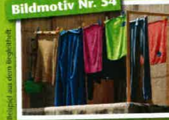
Bildmotiv Nr. 54

Bilder sprechen eine eigene Sprache – manches drücken sie besser aus, als Worte es könnten. Die 60 neuen ausdrucksstarken, symbolreichen und doch deutungs-offenen Motive der Sinnbildbox lassen sich gut mit Fragen nach Sinn, Gefühlen und Werten, aber auch mit „leichten“ Themen des Lebens und Glaubens verbinden. Ein Begleitheft schlägt zu jedem Bildmotiv Assoziationen sowie eine passende Bibelstelle vor. Es enthält zudem Anregungen für den Einsatz der Sinnbildbox – vor allem in der Schüler-, Konfi- und Jugendarbeit, aber auch in der Freizeit- und Erwachsenenarbeit. Die Sinnbildbox ist mit ihren Motiven auch ideal mit der Sinnbildbox 2 kombinierbar.