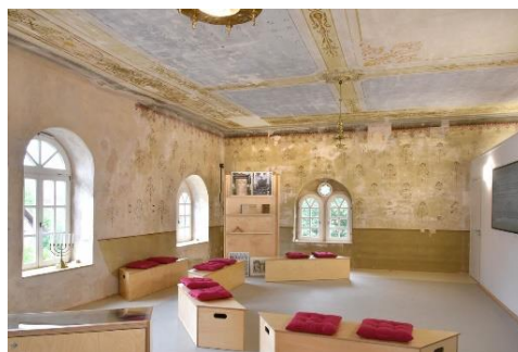
Innanansicht: ehemalige Synagoge Abterode