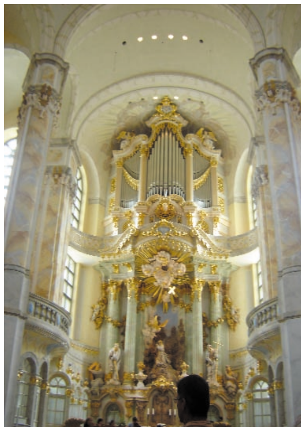
Anmerkung: Predigt im Universitätsgottesdienst am 17. April 2005 in Berlin.

Text: Hebr. 11, 1-3. Die Predigtform wurde hier weitgehend beibehalten, nur Bilder und Zwischenüberschriften von der Redaktion ergänzt.