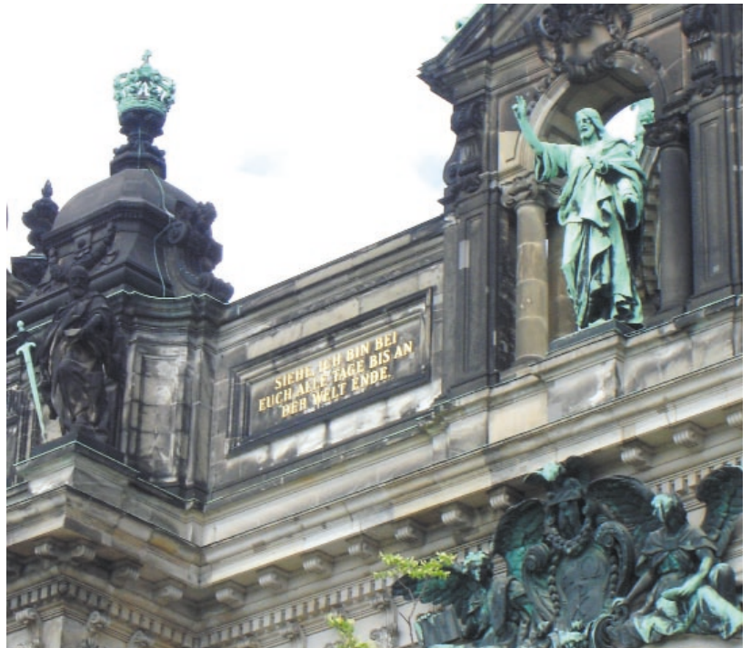
Berliner Dom: »Siehe, ich bin bei euch alle Tage bis an der Welt Ende«

Nun, die Bilder in unseren heutigen Kirchen sind es vermutlich weniger. Gerade unsere alte, im 13. Jahrhundert errichtete und architektonisch-künstlerisch immer wieder, besonders in der bilderfreudigen Barockzeit umgestaltete Marienkirche, ist voller Bilder. Schon in der Turmhalle kommt man an einem Totentanzgemälde aus dem 15. Jahrhundert vorbei, einem sehr verbreiteten Bildmotiv des späten Mittelalters. In diesen Bildern trat den Menschen die eigene Vergänglichkeit vor Augen, das memento mori , aber auch, dass vor dem Tode alle gleich sind, die Hohen und die Niedrigen, die Armen und die Reichen. Dann fällt die kunstvolle, barocke Kanzel, von Andreas Schlüter ins Auge. Sie zeigt im mittleren, zentralen Relief Johannes, den Prediger in der Wüste, den Herold, der den Christus, Gottes lebendiges Wort, ankündigt. Die Bilder und die reformatorische Konzentration auf das Wort ergänzen einander. An den Pfeilern sehen wir Bilder, die Jesu Verrat und seine Kreuzigung zeigen. Unweigerlich schließlich blicken wir auf die Altarbilder des Berliner Barockmalers Bernhard Rode von 1761, in der Mitte die Grablegung des Gekreuzigten. Es ist zugleich eine Pietà. Maria, die Gottesmutter, trägt ihren toten Sohn auf den Armen.