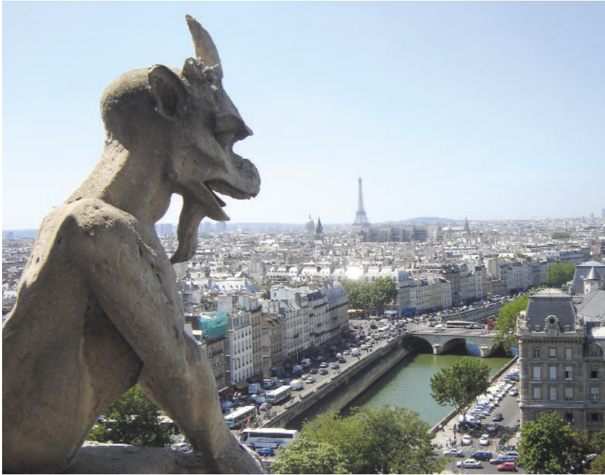
Paris, Notre Dame

Bilder, die die äußere und innere Wirklichkeit zeigen, Bilder, die bloßen Schein verbreiten, Bilder, die aufrütteln, Bilder, die etwas zu denken geben, Bilder die sichtbar machen, Bilder die schockieren, Bilder, die Gottes große Taten in Erinnerung rufen, Bilder manchmal sogar, die das Unsichtbare im Sichtbaren sichtbar machen, die Wirklichkeit öffnen, Ausblick gewähren in die Unendlichkeit, erkennen lassen, dass die Wirklichkeit im Vorhandenen nicht aufgeht, dass der Welt ein Geheimnis innewohnt, ein Gott. Das sind die Bilder großer Kunst!